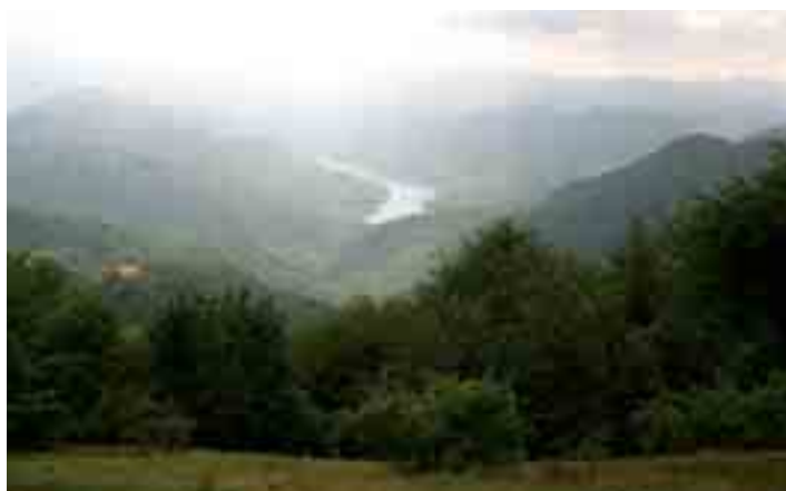
I terreni scelti per la costruzione del nuovo rifugio, 28 luglio 2004