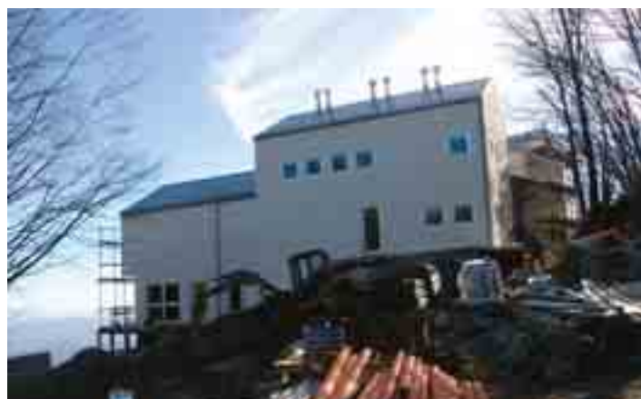
Ormai anche il colore è dato... 30 novembre 2006