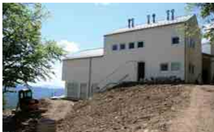
16 maggio 2007