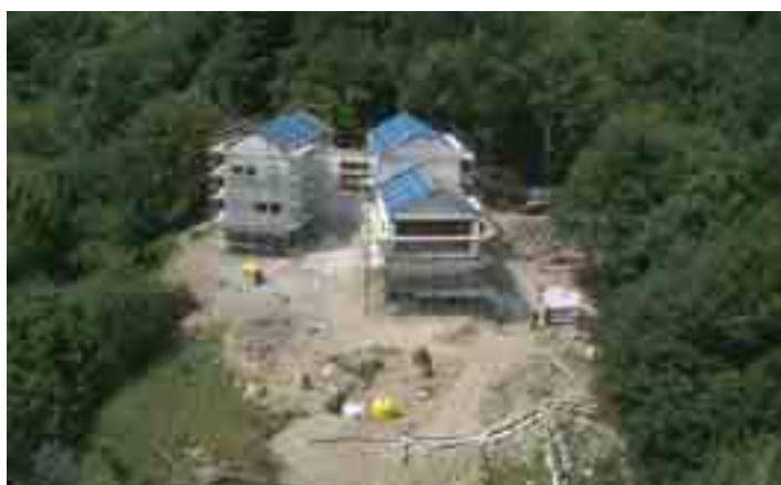
Il rifugio dall'elicottero, 11 agosto 2006