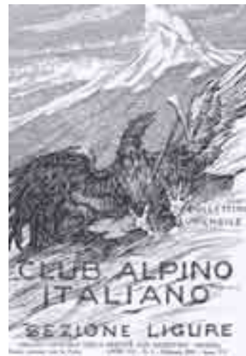
Copertina del "Bollettino mensile del Club Alpino Italiano - Sezione Ligure" datato febbraio 1929