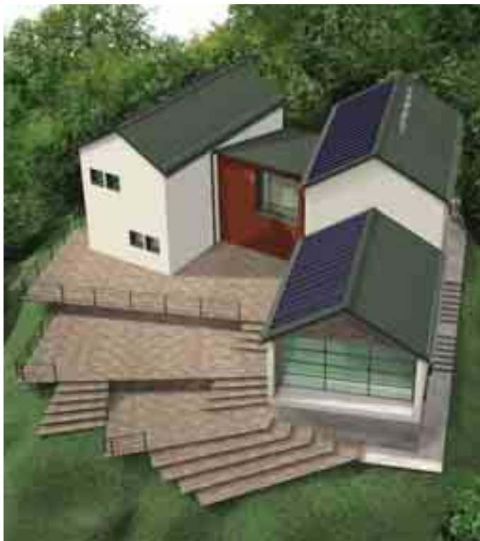
Il rifugio "Parco Antola"