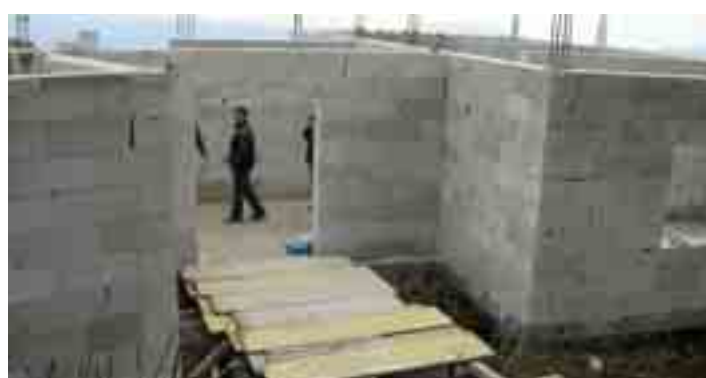
La parte posteriore con l'ingresso al rifugio, 26 aprile 2006