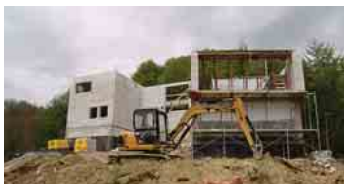
Ormai la struttura è visibile, 18 maggio 2006