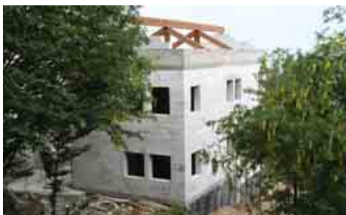
La posizione dei travi, 22 giugno 2006