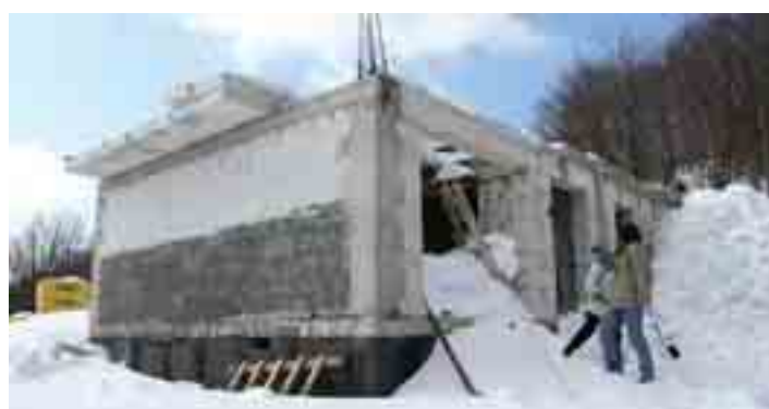
Sotto la neve i lavori procedono... 17 marzo 2006