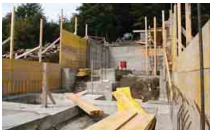
I primi muri portanti, 22 agosto 2005