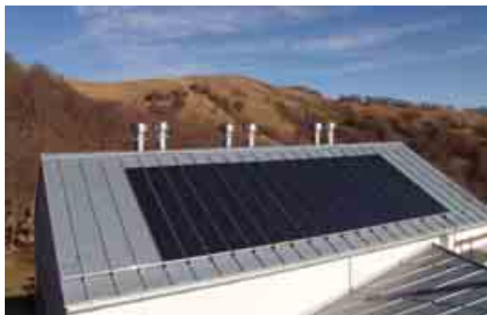
I pannelli fotovoltaici che assicureranno autonomia all'impianto elettrico.

Per il riscaldamento si sono messi in atto accorgimenti al fine di ridurre al minimo il consumo energetico: