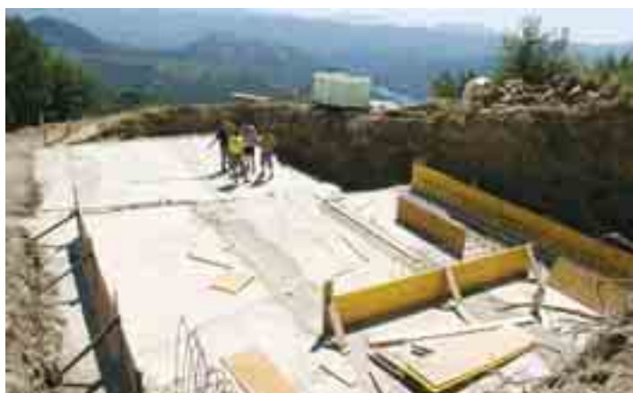
Le fondamenta, 1 agosto 2005