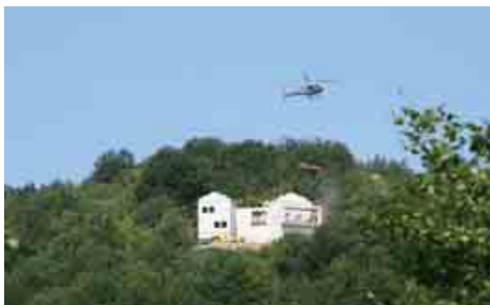
La posa dei travi in legno per il tetto, 22 giugno 2006