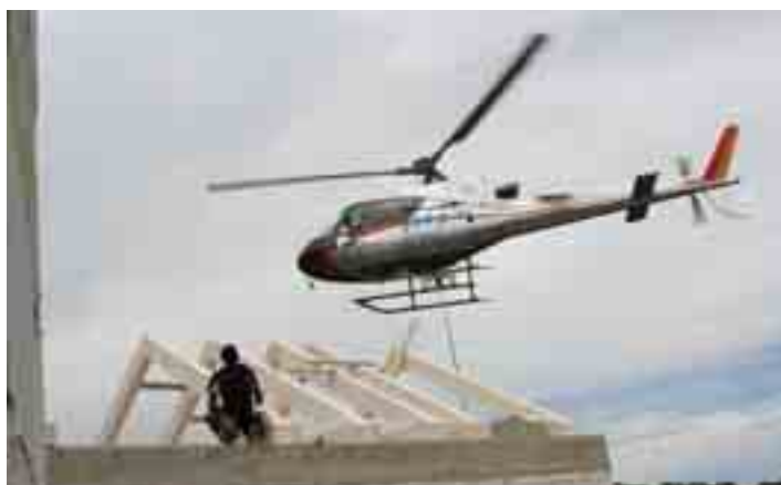
22 giugno 2006