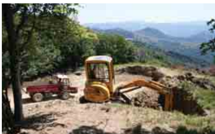
Le prime opere di scavo, 3 luglio 2005