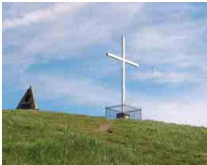
La croce sulla vetta dell'Antola

Piccola e Media Impresa) si è offerto di compiere i lavori di restauro con l'ausilio di tre ditte che metteranno le loro diverse competenze al servizio del crocifisso che identifica la vetta dell'Antola: MECCAR s.a.s. Meccanica Carpentaria, CMS S.r.l. Coloriture Sabbature industriali e IERARDI ANTONIO Costruzioni Edili. A loro un sentito ringraziamento da parte di tutti gli escursionisti.