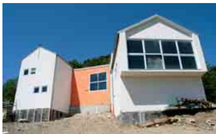
Ora mancano solo le terrazze esterne, 16 maggio 2007