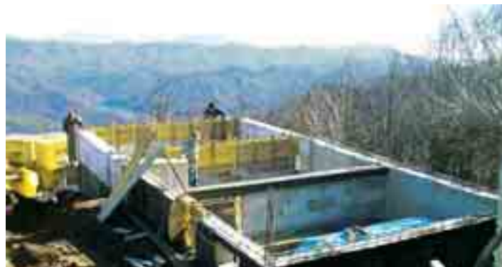
Lo scheletro c'è! 11 novembre 2005