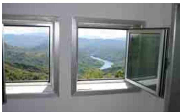
Il panorama dalle finestre, 16 maggio 2007