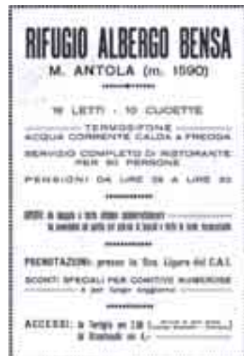
Pubblicità del rifugio Bensa sullo stesso numero del bollettino del CAI