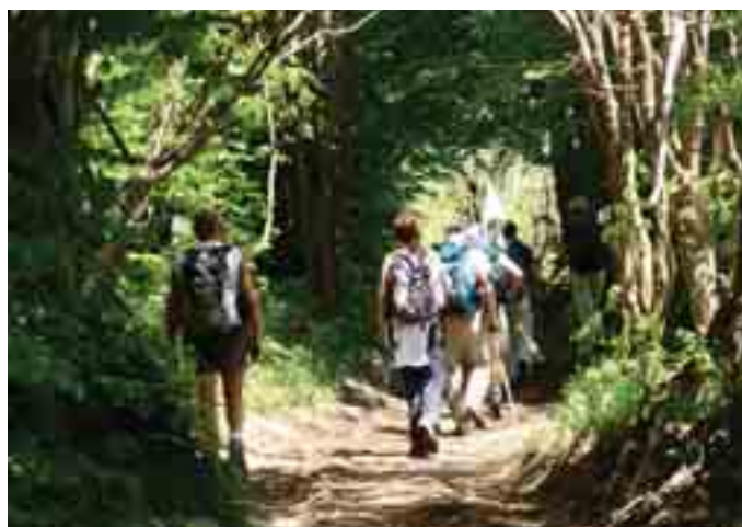
Escursionisti verso l'Antola