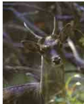
Esemplare giovane maschio di daimo

Trekking di due giorni alla scoperta della fauna del Parco con pernottamento presso il nuovo Rifugio "Parco Antola". Si parte sabato 29 nel pomeriggio con un'escursione di circa 2 h a partire da Bavastrelli dedicata all'osservazione faunistica e al riconoscimento dei segni di presenza delle principali specie e arrivo presso il rifugio per cena. In serata proiezione dedicata alla fauna del Parco. Domenica 30 , dal rifugio si intraprende il panoramico itinerario denominato L'anello del Rifugio per poi rientrare nel pomeriggio a Torriglia (pranzo al sacco, durata escursione 6 h circa). Per informazioni su costi, orari e modalità di svolgimento: Ente Parco 010 944175.