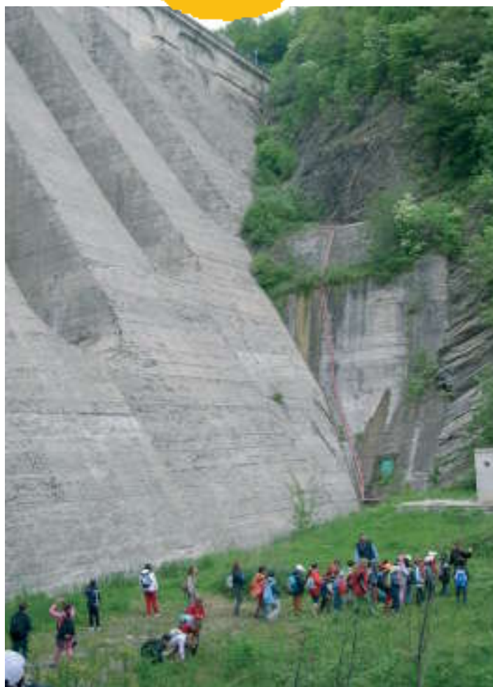
Scolaresca in visita al Lago del Brugneto