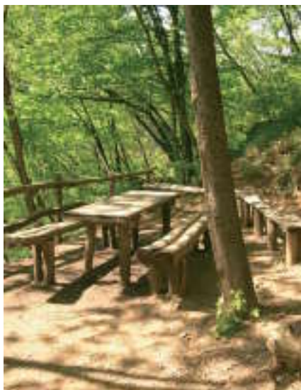
Area di sosta al Castello della Pietra

Il Comune di Vobbia, in accordo con la Provincia di Genova, ha affidato la gestione provvisoria del Castello all'Ente Parco Antola. Il Parco, conscio delle potenzialità del Castello intende arricchire la fruibilità del sito, attraverso l'allestimento di una sala proiezioni e prevedendo accompagnamenti guidati con personale qualificato. Sono stati inoltre realizzati, per conto del Parco e del Comune di Vobbia, interventi di pulizia e