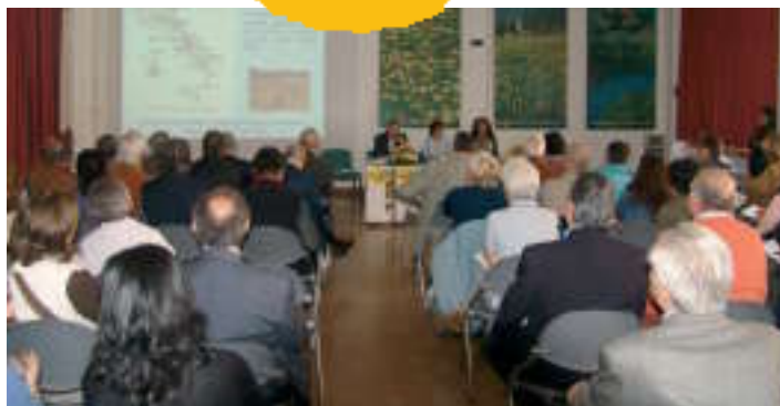
Torriglia: 17 maggio 2006 - convegno sul turismo sostenibile

di una volta contrapposti ai ritmi frenetici, alla crisi di valori, al superfluo, alla tecnologia esasperata, alla competizione, alla concentrazione, all'inquinamento.