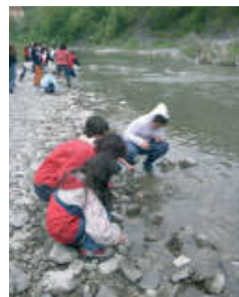
Attività didattica sul Torrente Scrivia

Centro Esperienze del Parco dell'Antola Via N.S. Provvidenza 3 16029 Torriglia Tel. 010.944175 Fax 010.9453007