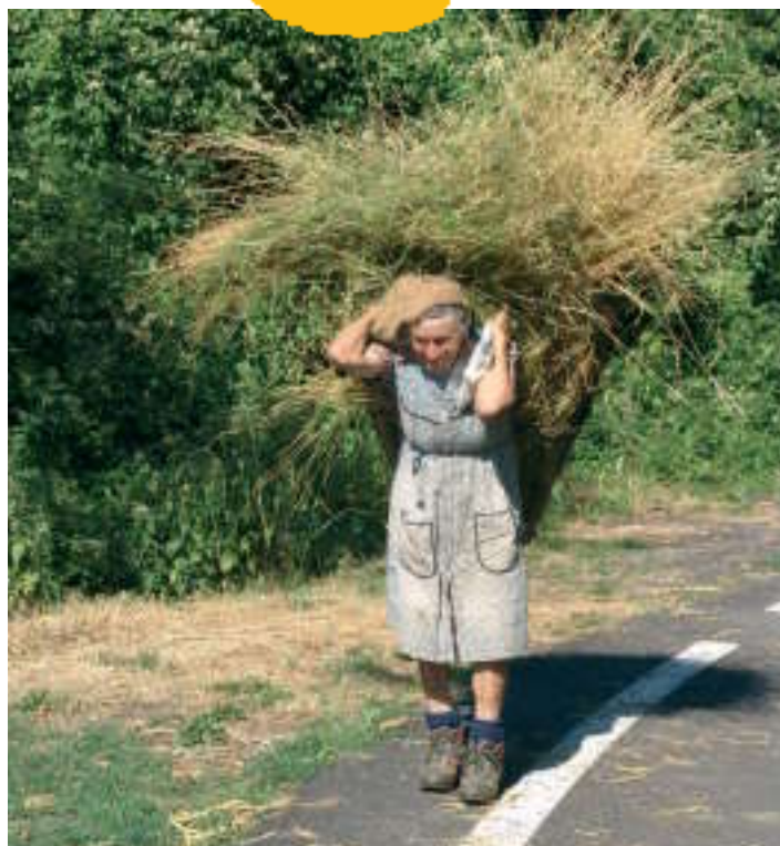
Trasporto del fieno.