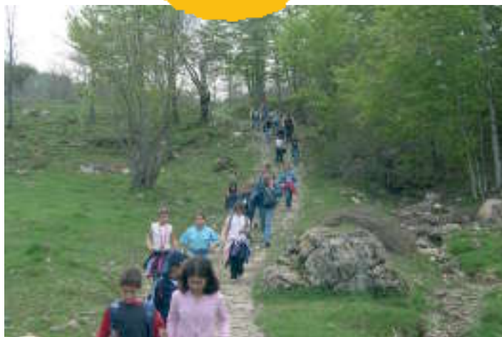
Scoprire il Parco

"...Dopo tanto cammino abbiamo visto il monte delle tre croci, soltanto che ad un certo punto ci siamo lamentati perché c'era ancora un monte da scalare molto ripido..."