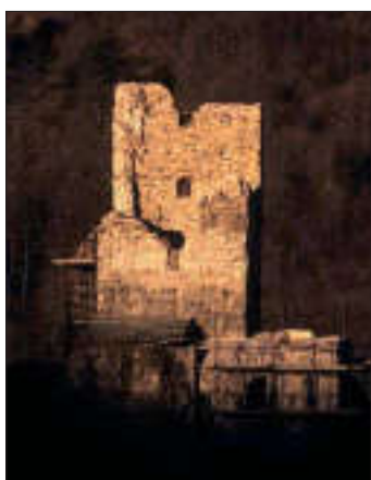
Il Castello dei Fieschi di notte