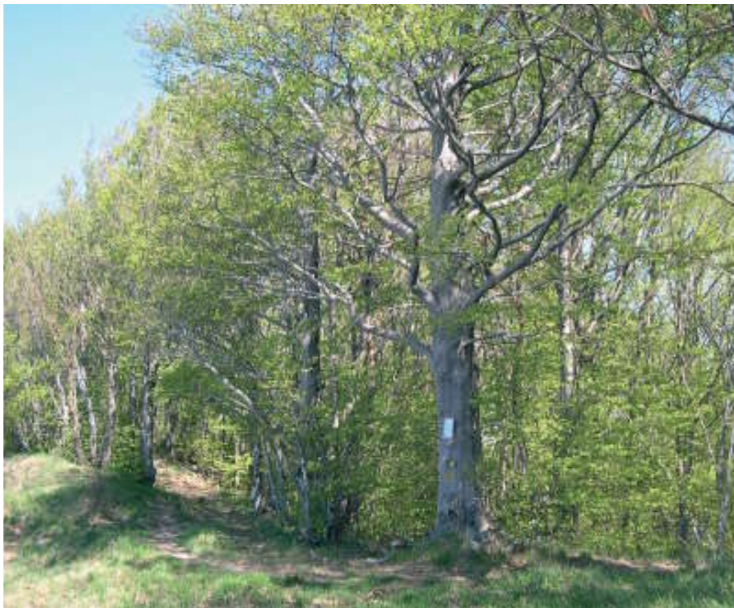
Lungo il percorso: faggeta.

Fera, come molti precursori, non ha avuto la fortuna di vedere il pieno compimento della propria idea. Tocca a noi, raccolto il suo testimone, fare in modo che la realtà dei parchi liguri si confermi e si rafforzi nel rispetto dell'originario progetto di riconoscere e preservare il valore del paesaggio di questi luoghi e di chi, nel tempo e con dura fatica, lo ha modellato così come abbiamo imparato a conoscerlo e ad amarlo. Percorrere in tanti il sentiero a lui dedicato in una bella giornata di sole, alla presenza della moglie e dei figli, delle autorità locali e di tanti soci di Italia Nostra può essere il modo più semplice per contribuire a realizzare compiutamente il "sogno" di Cesare Fera.