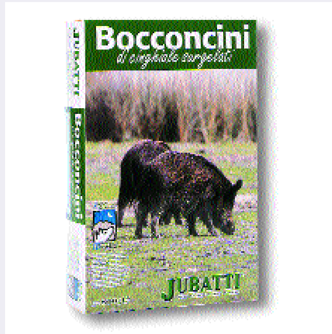
Prodotto con il marchio del Parco.

no non solo una attenzione distratta, come di solito avviene, ma devono essere incoraggiati nelle loro forme più genuine in quanto assumono una funzione insostituibile nella valorizzazione del territorio nelle sue accezioni ampie e nell'accrescimento delle microeconomie zonali. La ricerca assidua che viene fatta dei "loghi" dei parchi a sostegno di queste manifestazioni, sono, d'altronde, il riconoscimento di un ruolo importante e della funzione trainante delle aree protette nell'immaginario collettivo, una sorta di presa di coscienza con l'identificarsi in un campanile più vasto che non ha, di converso, le accezioni deleterie che sinora hanno contraddistinto una ricerca pervicace e perlopiù dannosa di autonomie negative. Ai dirigenti degli Enti Parco ed ai consigli delle comunità resta la capacità di guidare queste iniziative, non tutte convincenti ancora per la verità, inserendo le più significative in un calendario abruzzese, con il concorso della Regione, da poter offrire ai nostri tour operator.