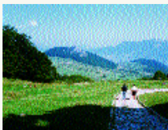
L'area interessata dal "Rave Party"

Gli avvenimenti che hanno "infuocato" l'estate del duemila nel Parco Nazionale della Majella meritano una riflessione ponderata.